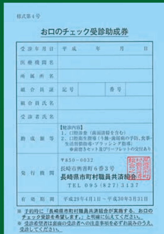
お口のチェック受診助成券